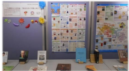
「カワサキの 100 タイトル」展示

各タイトルに応募者から寄せられたオススの一節や、本にまつわるエピソードが添えられた川崎への郷土愛が高まるアイテムとなっており、今後の読書普及事業に積極的に活用していく予定です。