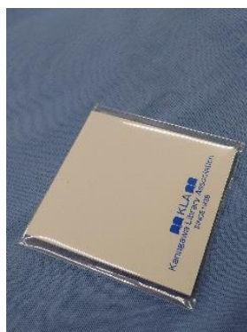
リーフレット「神奈川の図書館一覧」とオリジナル付箋

6日(水曜日)には、「展示ブースツアー」にて、当協会の紹介をさせていただく機会がありました。今井福司先生(白百合女子大学)が学生、図