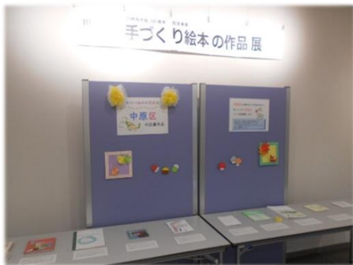
「手づくり絵本の作品展」

展示期間中にご覧いただけなかった方にも見ていただくことができるのは、電子図書館ならではの利便性であると感じています。