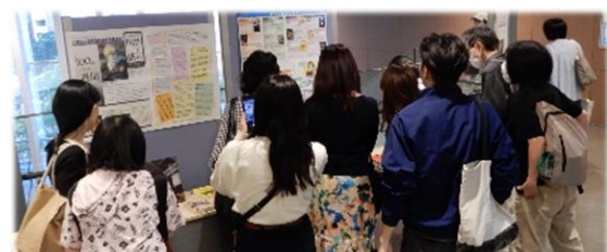
「100 周年記念 読書普及講演会」 終演後も展示コーナーに皆さん興味津々の様子でした。

これらの市制 100 周年記念事業を、川崎市立図書館の活性化と読書普及の推進につなげていきたいと考えています。